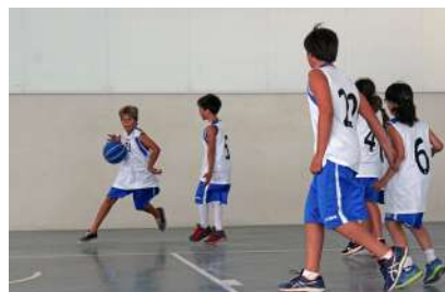
篮球学校和迷你篮球